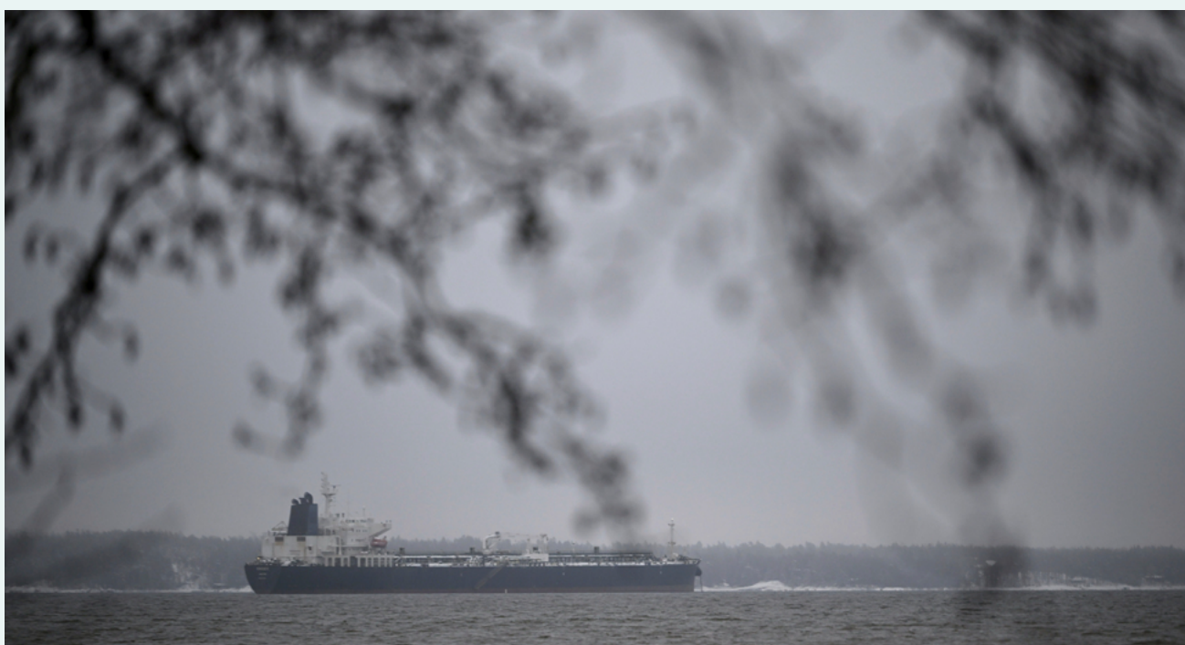
Oljetankeren Eagle S regnes som en del av «skyggeflåten» som frakter russisk olje i strid med europeiske sanksjoner. Eagle S er mistenkt for å stå bak sabotasjen mot kabler mellom Finland og Estland i 2022. Her er skipet i Finskebukta i januar 2025.

Som tidligere amerikanske presidenter, ønsker Trump at de andre NATO-medlemmene tar større ansvar for sikkerheten i Europa og en større del av regningen. Selv om NSS fastslår at stabilitet i Europa er et mål for administrasjonen, er det tegn på endring i USAs forhold til NATO og statens tradisjonelle rolle som garantist for sikkerhet i Europa. I den opprinnelige 28-punktsplanen USA presenterte i november 2025 for å avslutte krigen i Ukraina, foreslo Trump-administrasjonen at USA skulle megle mellom Russland og NATO – som om USA ikke selv var medlem av alliansen. Uttalelser fra administrasjonen sår tvil om USA fortsatt står ved forpliktelsene sine under artikkel 5 i den nordatlantiske traktaten, om at et væpnet angrep på et medlemsland regnes som et angrep på alle. I tråd med skepsisen til internasjonalt lovverk og multilaterale institusjoner, er NSS svært kritisk til EU og ser ut til å gi administrasjonen mandat til å blande seg inn i europeisk innenrikspolitikk for å støtte partier ytterst til høyre.