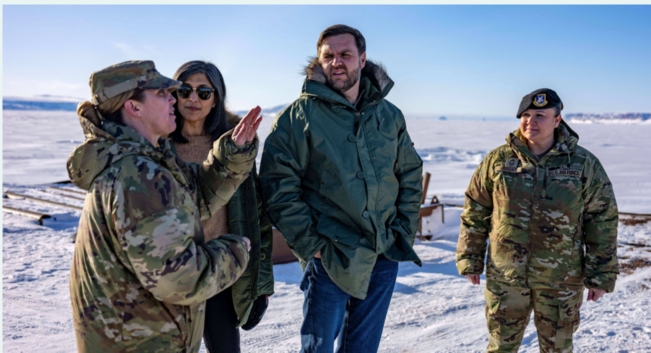
Som en del av stormaktsrivaliseringen i Arktis kjører USA et hardt løp mot Grønland. Her er visepresident JD Vance på besøk på den amerikanske militærbasen på Grønland i mars 2025, sammen med sin kone.

Dette notatet prøver å redegjøre for sikkerhetsmessig risiko i forskjellige scenarier som fremstår plausible i lys av politiske og økonomiske utviklingstrekk i Russland, som er den dominerende makten i nærområdet. Samlet sett gir dette et bilde av utfordringer, og til dels trusler, men også enkelte muligheter for Norge som olje- og gassnasjon. Uansett er det liten tvil om at virksomhet i Barentshavet er knyttet til særlig høy risiko som det vil være ressurskrevende å møte.